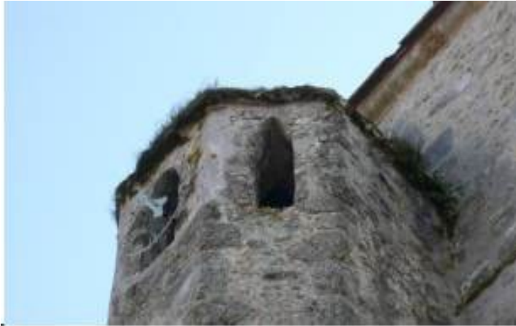
Présence de mousse et végétalisation et en particulier sur le glacis de couverture de l'escalier du clocher