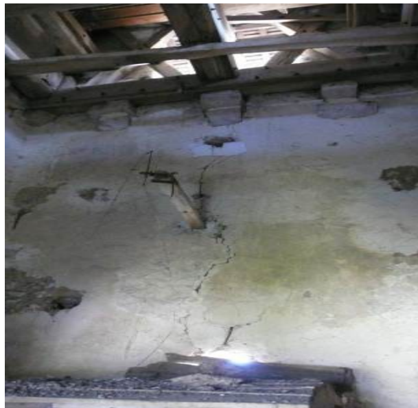
Mur occidental du clocher