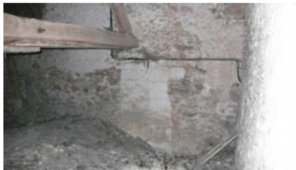
1ère ferme depuis clocher dont l'entrait a été moisé et maintenu en mauvais état