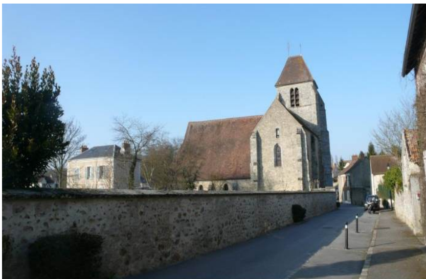
Vue sur le massif méridional