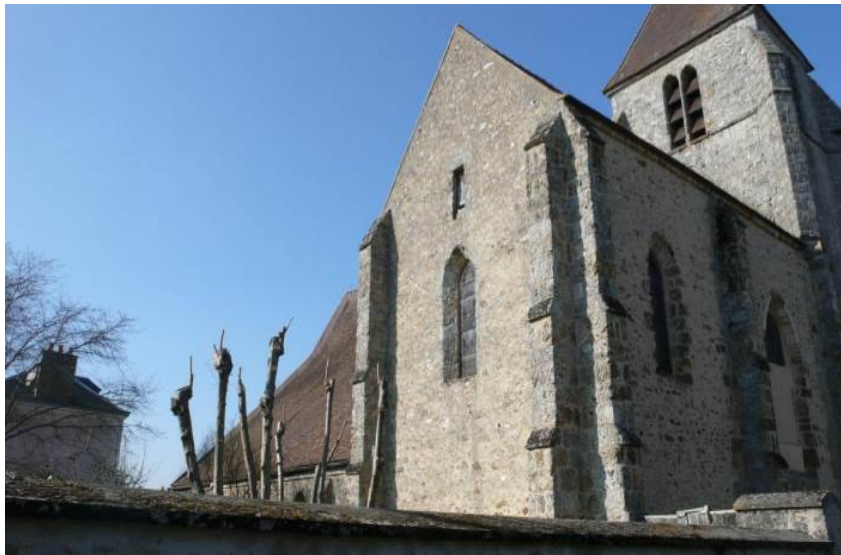
Vue sur l'extrémité du bas-côté, le chœur et le clocher