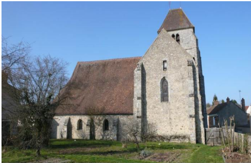
Massif méridional depuis l'ancien cimetière