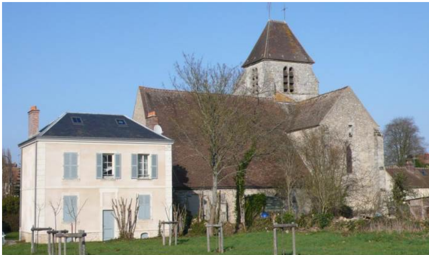
Massif méridional et presbytère