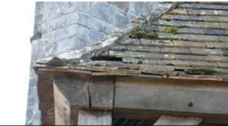
Perte d'éléments de couverture