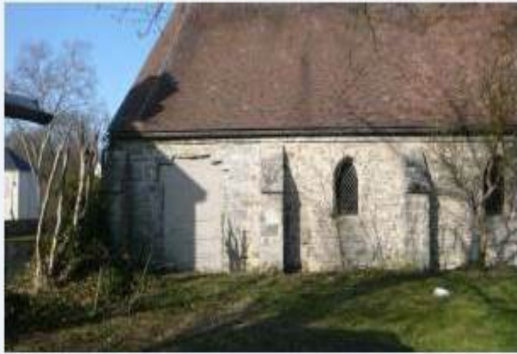
Porte des Morts