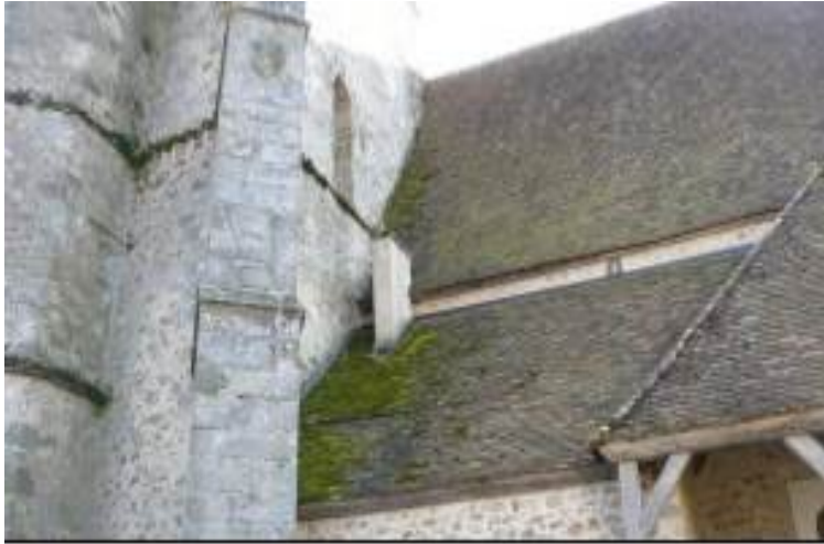
Présence de mousse et végétalisation